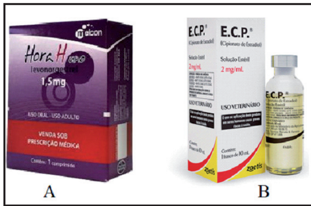
Figura 1. Embalagens comerciais de anticoncepcionais. A- anticoncepcional de emergência (pílula do dia seguinte) de uso humano. B- Anticoncepcional de uso veterinário indicado para cadelas e gatas.