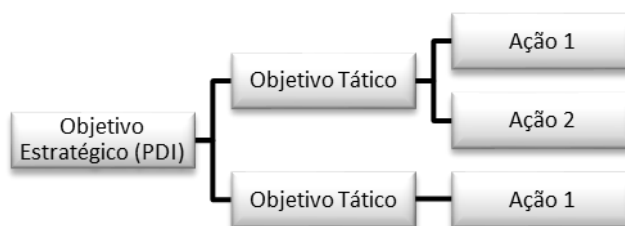
Figura 2: Estrutura Plano de Gestão

Os objetivos estratégicos do PDI são objetivos amplos de longo prazo. No Plano de Gestão, esses objetivos são desdobrados em objetivos táticos de médio prazo, que foram definidos a partir da convergência entre as propostas do programa “UFRGS Plural e Inovadora” e os objetivos contidos no PDI. Os objetivos táticos, por sua vez, são compostos por ações que devem ser realizadas para o objetivo ser cumprido. A estrutura do Plano de Gestão é apresentada na Figura 2.