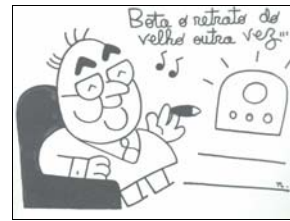
FAUSTO, Bóris. Getúlio Vargas : o poder e o sorriso. São Paulo: Companhia das Letras, 2006.

Esta charge, inspirada em uma marcha de carnaval interpretada por Francisco Alves, faz referência