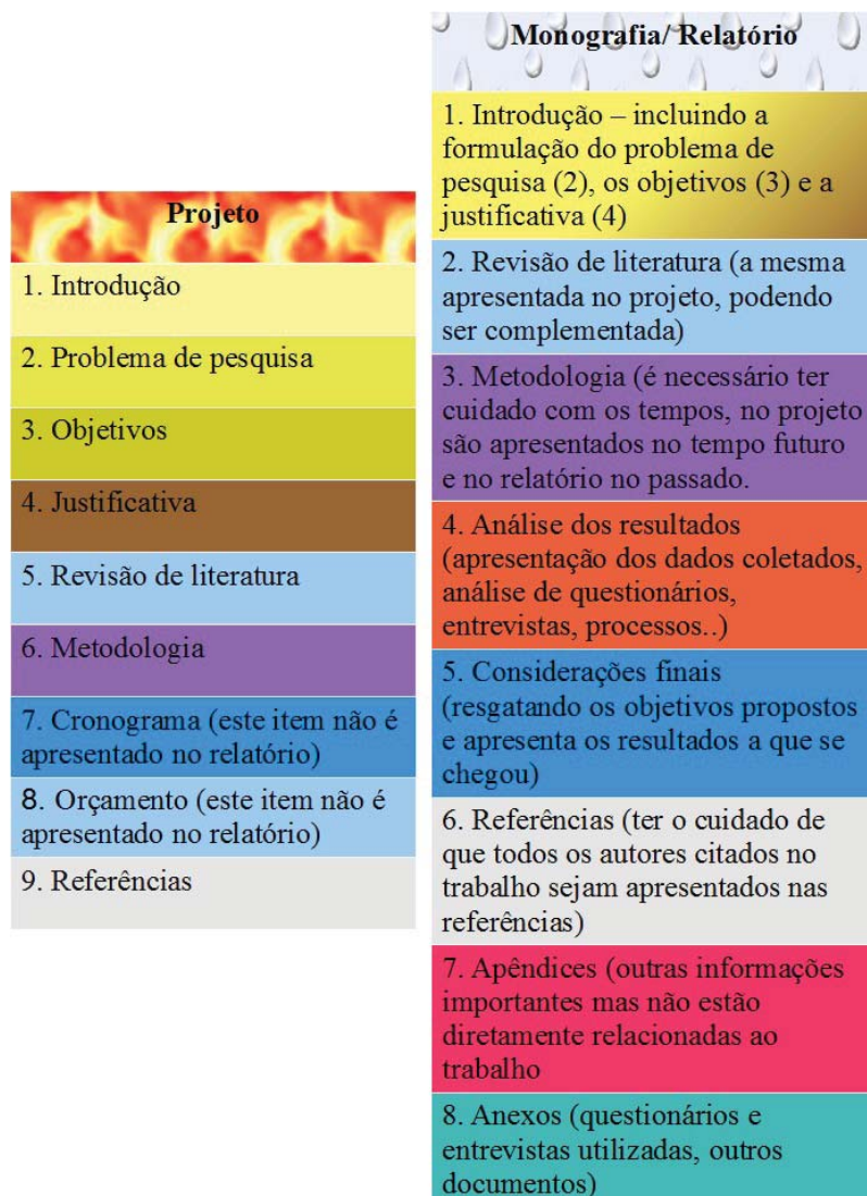
Figura 1 – As etapas da monografia Elaborado por Simone Bochi Dorneles, 2011.

Salienta-se que a parte superior da figura indica o estado de ânimo que envolve cada uma das etapas. A fase de elaboração do projeto constitui uma fase de efervescência de ideias; as chamas representam o calor dessa fase, em que os confrontos de teorias, reflexões e pensamentos são mais contraditórios e de difícil síntese. Na fase de elaboração da própria monografia, o estado de calma ou tranquilidade da água está relacionado à serenidade necessária para se poder desenvolver e elaborar com êxito a redação do trabalho de conclusão.