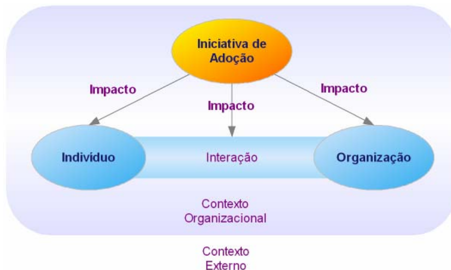
Figura 1 – Modelo teórico simplificado do planejamento da adoção de iniciativas móveis na interação entre organização e indivíduo.

O modelo teórico proposto busca abranger o contexto envolvido na adoção das tecnologias móveis na interação entre organização e indivíduo, integrando as variáveis de ambiente e compreendendo assim sua influência no planejamento desse tipo de iniciativa e de seu impacto no indivíduo, na organização e na interação entre eles.