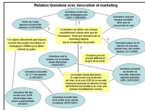
Figure-3 : Relation Grendene avec innovation et marketing

Sur la Figure-3 nous regroupons les informations et les idées qui en sont induites concernant l'innovation et le marketing, comprises au sens de la fixation d'un produit "fort" avec succès dans le marché mondial. Ceci est important car chaque fois que le produit est vu les actions sont rappelées. Le produit de Grendene doit soutenir une bonne image car, dans le cas contraire, il amènerait inévitablement à la baisse des actions (parts de capital).