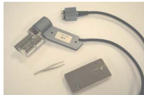
Termômetro BSU 102