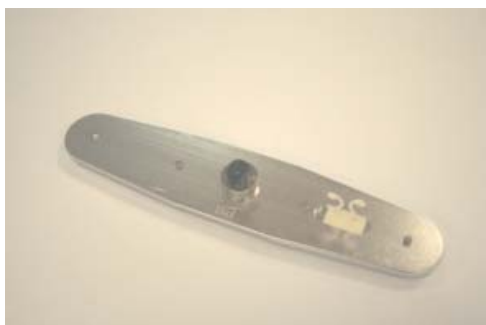
Travessa de fixação dos sensores