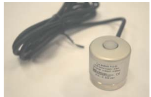
Radiômetro BSR 030