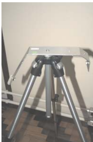
3 Posicionar a peça BVA 306 sobre o pino do tripé.