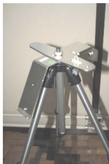
8 Tripé montado.