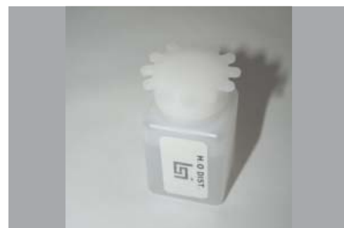
Tubo de água destilada