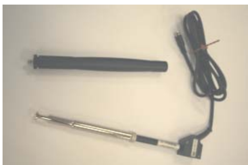
Anemômetro BSV 101