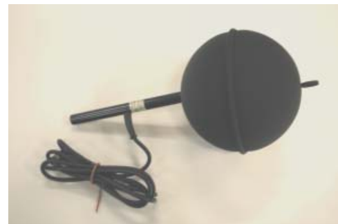
Termômetro de globo BST 131