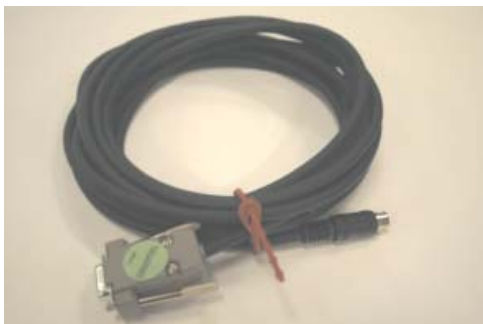
Cabo de conexão BSH 100