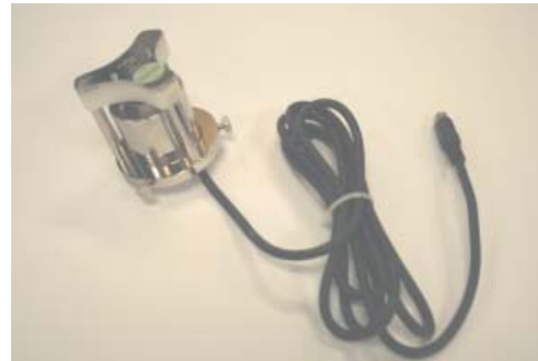
Termômetro BSU 121