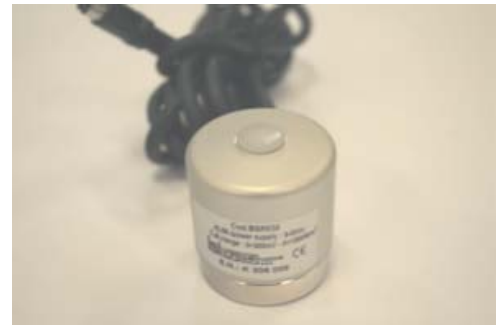
Luxímetro BSR 001