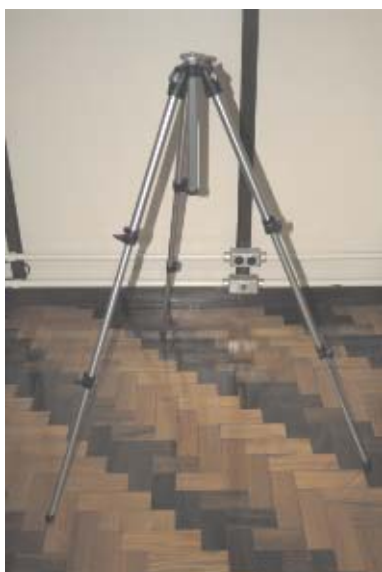
1 Abrir o tripé, abaixar as hastes e fixar as presilhas.