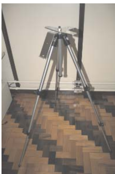
7 Tripé montado pronto para receber os sensores.