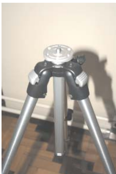
2 Nivelar o tripé ajustando a altura das hastes.