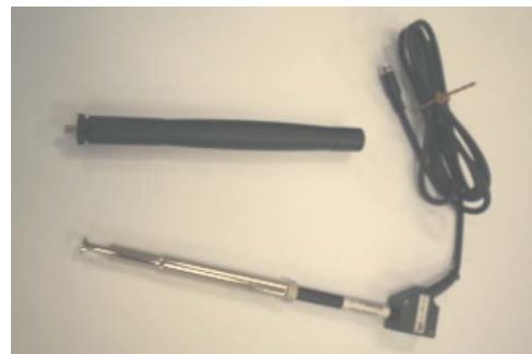
Anemômetro BSV 101

• Se surgirem impurezas, deve-se retirar a sonda do BABUC, imergir a cabeça em um solvente (como álcool, acetona ou água destilada), mexer e secar. Se restarem impurezas, é recomendável enviar a sonda para o LSI.