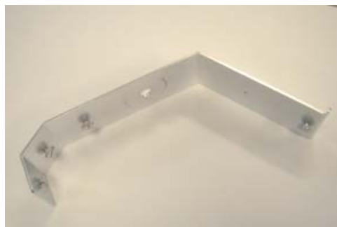
Peça de fixação BSV 306