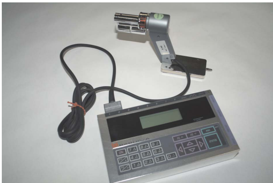
Termômetro de bulbo seco e úmido forçado montado sobre seu pedestal.