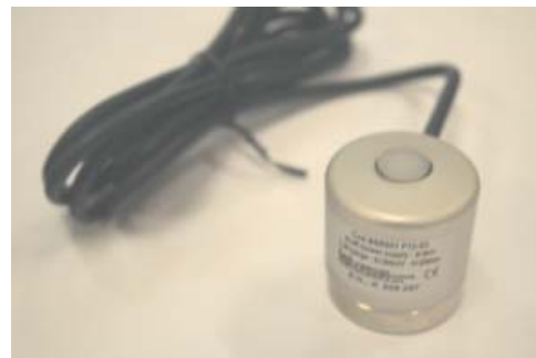
Radiômetro BSR 030