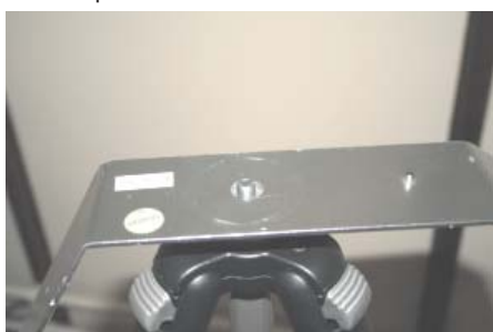
4 A peça ficará solta sobre o tripé.