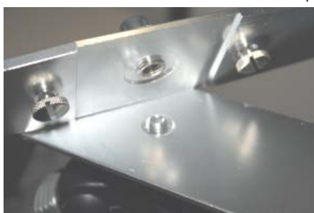
5 Fixar a travessa de apoio dos sensores no pino do tripé.