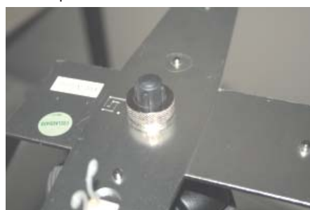
6 Rosquear o pino até fixar.