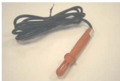
Termômetro BST 101