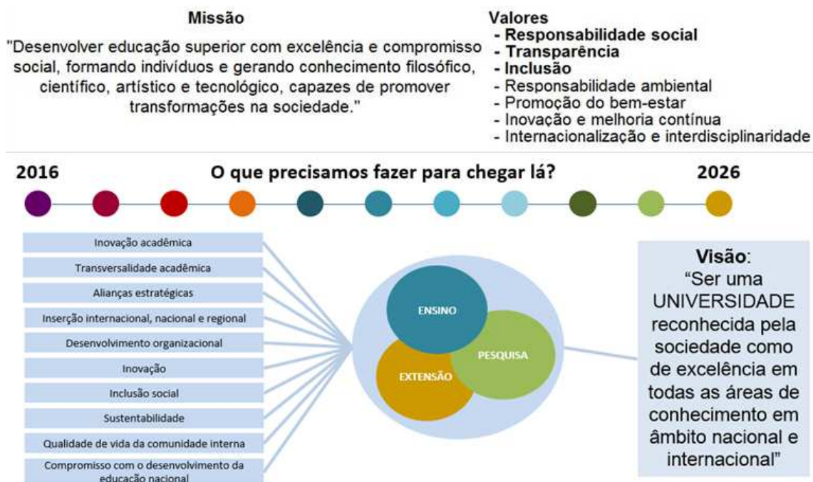
Figura A1.4 – Elementos de identidade institucional constantes no instrumento de consulta pública

O formulário completo do instrumento de consulta pública permanece disponibilizado no site do PDI – www.ufrgs.br/pdi/ em Consulta Pública.