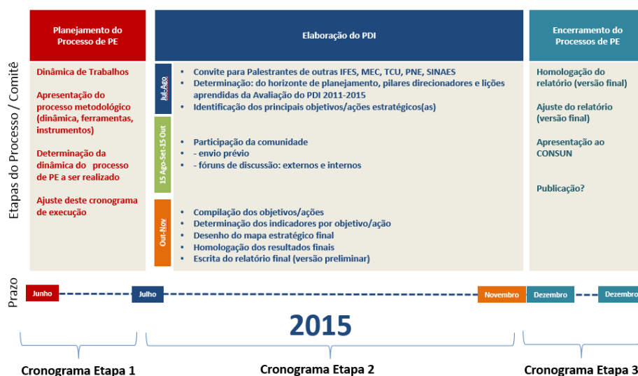
Figura Al.1 – Linha de tempo preliminar do processo do novo PDI

A etapa de planejamento para a elaboração do PDI compreendeu os seguintes itens: criação do Comitê do PDI e da Comissão de Comunicação, criação dos ambientes de colaboração; identificação de quais seriam os componentes do processo de planejamento e o método para obtenção dos objetivos estratégicos. Inicialmente, foi projetada uma linha de tempo preliminar (Figura Al.1) para que se tivesse uma ideia das etapas, componentes e tempo necessários para a elaboração do novo PDI.