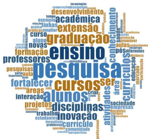
Figura A1.6 – Exemplo da formação de clusters