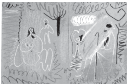
3 Almoço na Relva, de Pablo Picasso, creiom, 23 de março de 1963. WOODFORD, op. cit.

Idéia é a forma originária, a imagem mental do que o artista pretende antes de executar a obra. É no que o artista se inspira para criar, não importa se esta Idéia , este arquétipo ao qual dirige o olhar, esteja fora dele - no