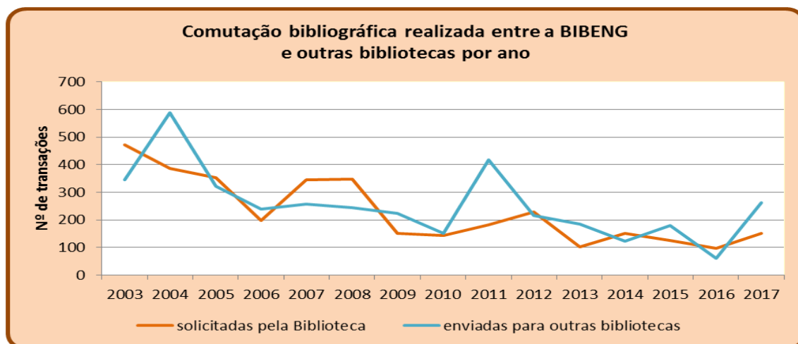
Figura 3: Transações de comutação bibliográfica entre bibliotecas

A comutação bibliográfica realizada entre instituições parceiras, com o advento do Portal da Capes, vem diminuindo gradativamente nos últimos anos, já que se refere sobretudo à complementação de acervos de periódicos, os quais cada vez mais encontram-se naquele site . A Figura 3, contudo, demonstra pequeno aumento em relação ao ano anterior nos pedidos desta BIBENG para outras instituições, bem como no atendimento de pedidos de outras bibliotecas.