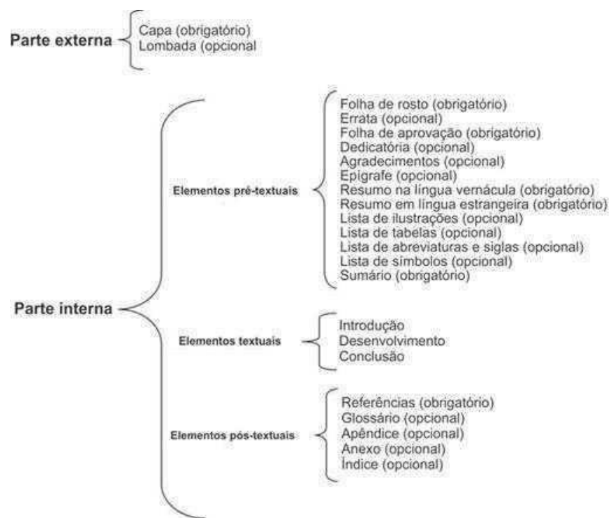
Figura 1 - Estrutura do trabalho acadêmico