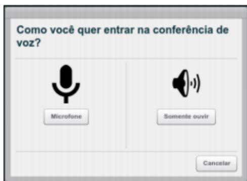
Figura 1. Clicar em "Microfone"

Ao acessar a sala virtual (link), será necessário verificar se microfone está funcionando bem. Utilize a opção “microfone”.