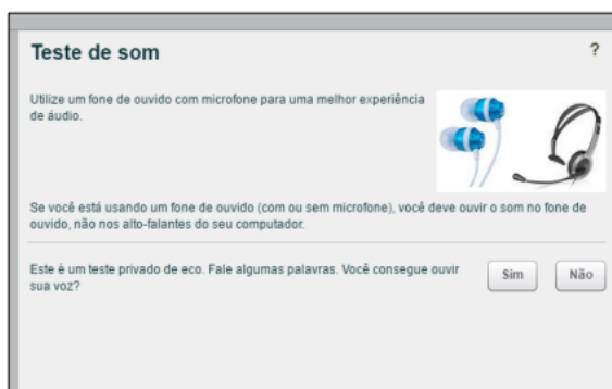
Figura 2. Se ouvir sua voz, clicar em "Sim"