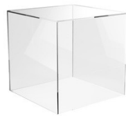
Figura 3 - Cubo de acrílico