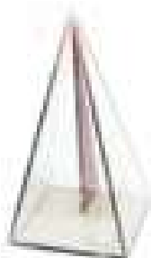
Figura 2 - Pirâmide de acrílico

Fonte: Imagem retirada do Google Imagens