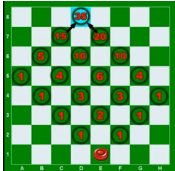
Figura 2 - Triângulo de Pascal (Dama)

Universidade Federal do Rio Grande do Sul (UFRGS) Instituto de Matemática e Estatística (IME) Departamento de Matemática Pura e Aplicada (DMPA)