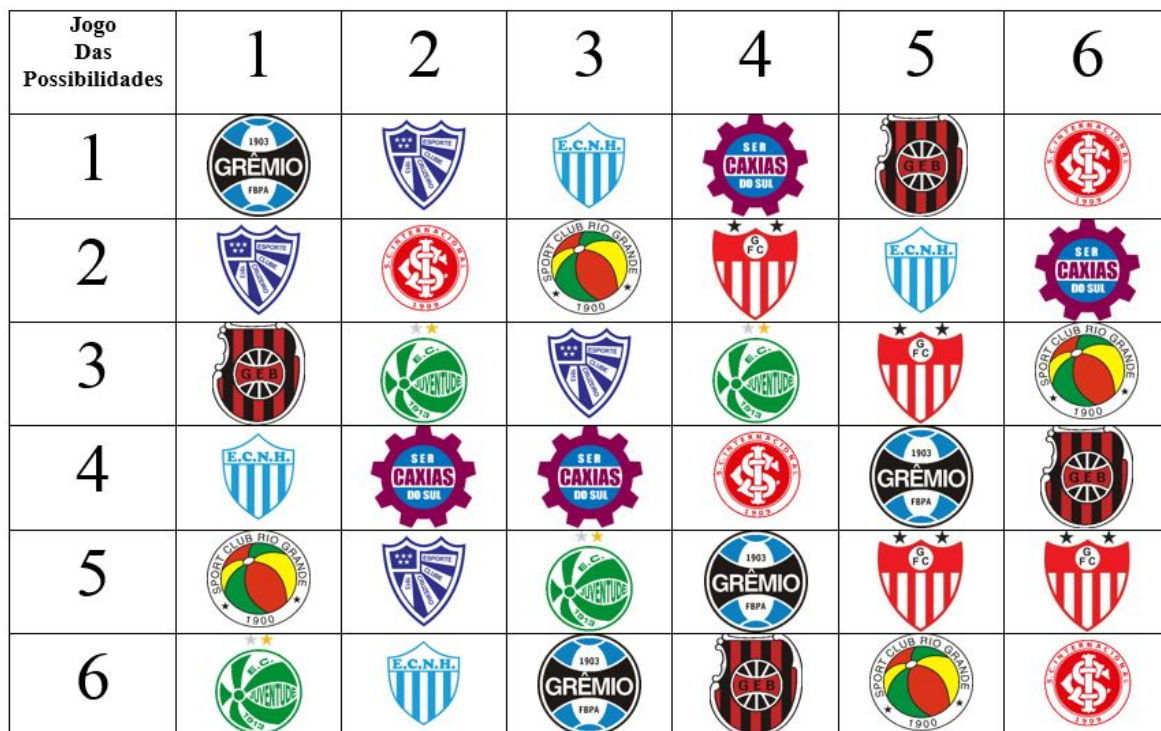
Figura 1 - Jogo das Possibilidades