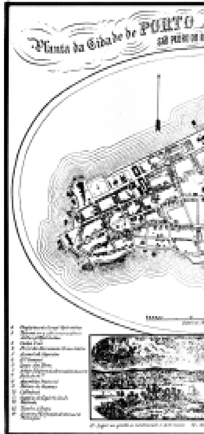
FIG. 4 Planta de Porto Alegre, 1869. Clévis Oliveira, 1993.

Em 1943, o Plano de Gladosch previu a modernização e a monumentalização dos dois centros cívicos existentes: o municipal 12 e o estadual. Os croquis de Gladosch demonstram a intenção de estabelecer uma certa continuidade estilística e morfológica entre os Palácios da Praça da Matriz e o tecido circundante. Entretanto, a reordenação do conjunto através de eixos e simetrias parciais e a substituição dos antigos edifícios por prédios racionalistas referenciando-se aos projetos urbanos do italiano Piacentini, alterariam completamente a configuração que a Praça da Matriz possuía naquele momento. No projeto para o novo 'Centro Administrativo Estadual', o espaço aberto da Praça dividiria-se em três partes: com o rebaixamento do trecho da Duque de Caxias fronteiro ao Palácio do Governo e à igreja, que já estava sendo substituída pela atual Catedral, a primeira corresponderia a um patamar mais elevado que a rua, convertido em praça de honra, em situação análoga