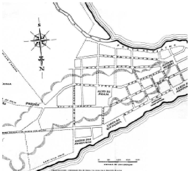
FIG. 2 Planta de Porto Alegre em 1772. Clávis Oliveira, 1993.