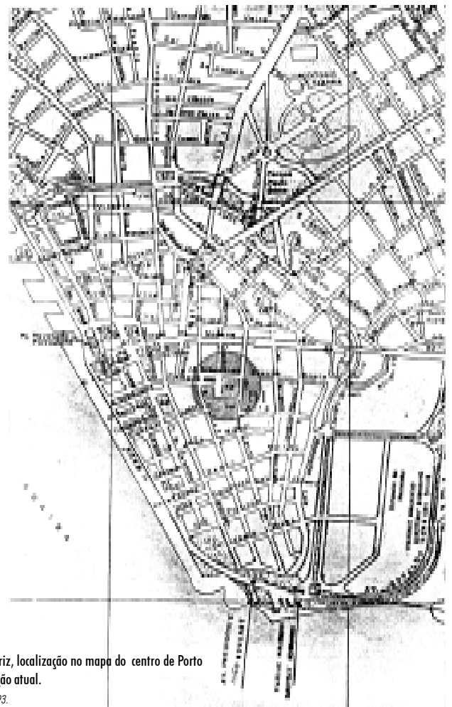
FIG. 1 Praça da Matriz, localização no mapa do centro de Porto Alegre, situação atual. Clóvis Oliveira, 1993.