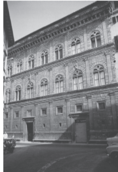
1 VISTA PALAZZO RUCELLAI TAVERNOR, 1998, p. 84

A construção do Palazzo Rucellai desenvolve-se em dois níveis além do térreo, divididos por linhas horizontais de cornija. No térreo há dois acessos, coroados por janelas e circundados por pequenas aberturas de ventilação. As duas portas de entrada retangulares são flanqueadas por bancos voltados para o passeio, que se estendem ao longo de toda a frente: plataformas em pedra típicas do século XV e que ainda hoje servem de descanso aos passantes. A geometria que regula a fachada é a das ordens clássicas, com proporções e ritmos marcados. Parte deste repertório formal pode ser observado na fina camada que reveste o corpo do edifício. Pilastras planas sintetizam colunas completas, base, fuste e capitel, depois entablamento completo, com a arquitrave separando os três níveis iguais (Figuras 2). Alberti desenhou uma pele racional para o Palazzo Rucellai – uma espécie de arquitetura de fachada na qual os elementos clássicos não desempenham nenhum papel estrutural. Imitando em parte o Coliseu, os capitéis variam do toscano (ordem inferior), passando por uma invenção do próprio Alberti (folhas de acanto), até o coríntio na ordem superior (Figuras 3).