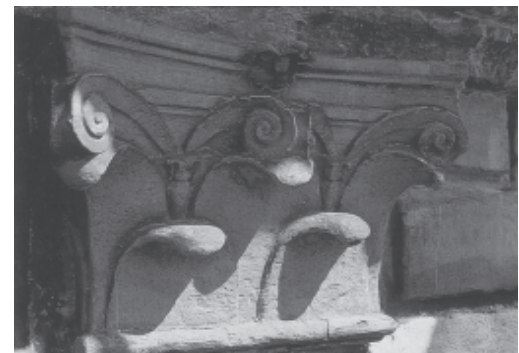
3 DETALHE PALAZZO RUCELLAI TAVERNOR, 1998, p. 85