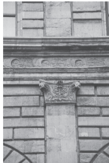
2 DETALHE PALAZZO RUCELLAI TAVERNOR, 1998, p. 84